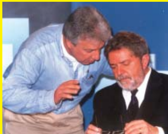
Fausto com Lula, contra as desigualdades

passagens em ônibus intermunicipais os portadores de doenças crônicas e degenerativas, como vítimas de câncer, Aids e paralisias, para que possam se deslocar e fazer tratamento de saúde.