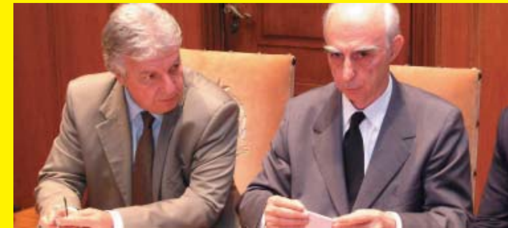
Fausto com o governador Lembo, em defesa do Estado, contra o crime organizado