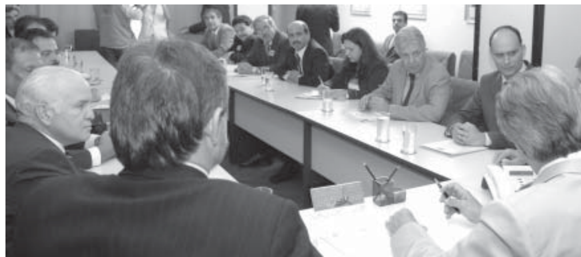
Prefeitos da Baixada e Fausto Figueira no Ministério da Saúde, em defesa do consórcio regional

Para enfrentar a crise hospitalar na Baixada, Fausto defende a formação do Consórcio Intermunicipal de Saúde, integrando quatro hospitais para atender 1,5 milhão de pessoas.